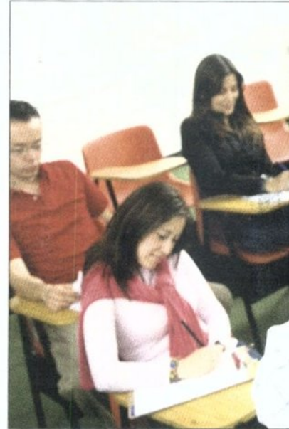
In wirtschaftlich herausfordernden Zeiten ist Weiterbildung ein zentraler Wettbewerbsfaktor. Statt auf kurzfristige Einsparerfolge zu setzen, haben viele Unternehmen den langfristigen Return of Investment mit Weiterbildung im Visier.

Laut einer aktuellen Umfrage der Plattform für berufliche Erwachsenenbildung, bei der 500 Personalverantwortliche befragt wurden, lassen 76% der Betriebe das